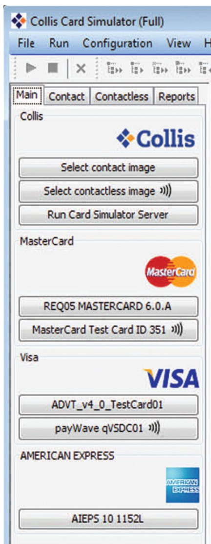
Главное меню имитатора карт компании Collis

Имитатор карт компании Collis может действовать точно так же, как реальная карта, включая обработку логики приложения. Однако, в отличие от реальной карты, если Вы заблокируете PIN или карту, Вам потребуется только перезапустить имитатор, и он вернется к исходным настройкам. Имитатор карт компании Collis может имитировать как правильно функционирующие карты, так и поврежденные карты. Имитация работы этих карт с ошибками важна для определения поведения терминала при проведении транзакции с поврежденной картой.