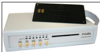
Устройство SmartLink Box компании Collis для имитации контактных карт

Устройство SmartLink Box компании Collis является обязательным при использовании имитатора карт компании Collis для контактных карт. При имитации карты устройство SmartLink Box компании Collis используется для обмена сообщениями с терминалом через датчик (карта размером с банковскую карту), вставляемый в терминал. У нас также имеется специальный датчик для устройств считывания данных в банкоматах.